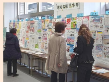
18地域の広報誌・チラシが勢揃い！圧巻です。

地域恒例の盆踊り・夏祭りや防災訓練など、それぞれの地域が力を入れている事業や活動がよくわかる力作が勢揃いしました。18地域全部を一度に観覧できるとあって、地活協フォーラムに参加された方々も他地域の広報活動にとっても興味深げな様子でした。