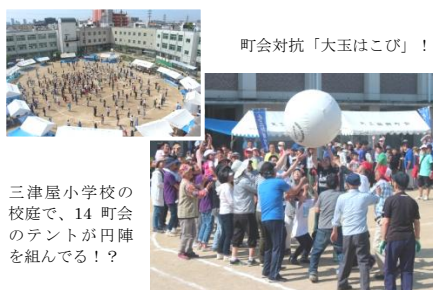
町会対抗「大王はこびり！」

5月12日(日)に開催されたみつやの運動会。小さな子どもから高齢者までとても楽しそうでした。町会対抗の競技では「がんばれー！」の声援にも熱が入り、地域の皆さんの気持ちが一つになっているように感じました。