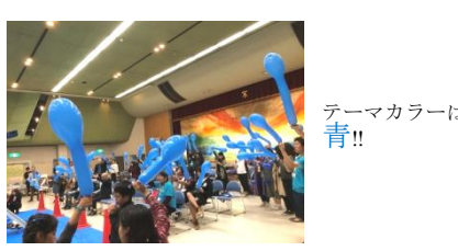
テーマカラーは青!!

4月14日(日)淀川区民センターで「世界自閉症啓発デー」に合わせた「淀川アオクスルまつり」が実施されました。発達障害支援や就労支援に関する相談コーナー、学びのセミナー、体験コーナーなど、みんなの「ええとこ」を再発見するきっかけとなるイベントでした。