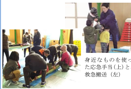
身近なものを使った応急手当(上)と、救急搬送(左)

10月の避難所開設訓練に引き続き、2月4日(日)神津小学校で防災訓練が行われました。地域住民約130名が参加し、一時避難場所から小学校への避難訓練のほか、救命救急や救出搬送等の訓練を実施。消防署による防火講演では、家庭内に潜む思わぬ火災の要因について学びました。