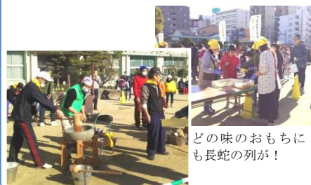
どの味のおもちにも長蛇の列が！

12月17日(日)に木川小学校で、もちつき大会が開催されました。地域住民約850名が参加し、定番のあんこやきなこのほか、お雑煮などバラエティ豊かな7種類のおもちを楽しませていました。外国から移住されてきた方や、一人暮らしのご高齢の方も参加され、周りの方と話をしながら、つきたてのおもちに舌鼓をうっていました。