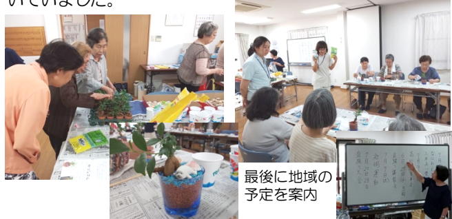
最後に地域の予定を案内

6月25日(月)木川いきいき教室では、参加者のみなさんがガジュマルの木のハイドロカルチャー(土を使わない水耕栽培の観葉植物)を作りました。「この木がかわいい」「飾りの貝はこれが素敵」と、皆でわいわい。作り終わると思い思いの個性的な鉢植えの出来栄を見比べて、話に花が咲いていました。