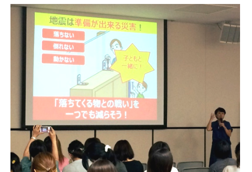
子どもと一緒に地震に備える大切さも教わりました