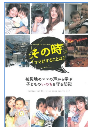
スマートサイバープロジェクト発行

「災害が起こった瞬間、自分と子どもの命をどう守るのか?その時の「ワンアクション」をあらかじめ決めておく」という言葉が印象的でした。