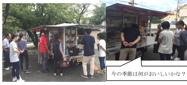
今この季節は何がおいしいかな?

加島買い物支援の一環として5月から始まったコープこうべの移動店舗販売会は、毎週金曜日の10:30から開催されています。9月14日には、淀川区社会福祉協議会へ夏期実習で来ている大学生たちが見学に訪れました。常連の利用者さんと一緒に買い物の話題で楽しく盛り上がり、みんなが笑顔の場となりました。