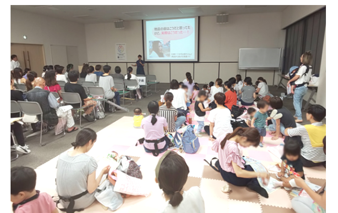
淀川区役所協力のもと、場内にマット敷きの親子スペース、授乳スペースや乳母車置き場を用意し、開催しました