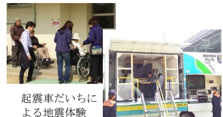
起震車だいちによる地震体験

3月25日(日)野中地域で防災訓練が行われました。各町会の一時避難場所から小学校への避難訓練の後、消火訓練やロープ結索、警察署による防災展示、区社協と障害者福祉施設「希望の園」による車椅子体験など、災害に備えいろいろな体験が出来る訓練となりました。