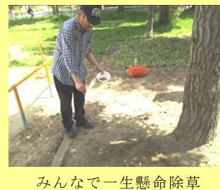
みんなで一生懸命除草した後に種を蒔きます