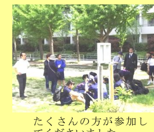
たくさんの方が参加してくださいました