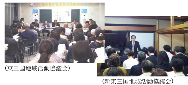
(東三国地域活動協議会)

各地域活動協議会で総会(運営委員会など)が開催され、H29年度の事業実施報告、収支決算報告とH30年度の事業計画、予算計画の提案が承認されました。また、役員改選にあっている地域では、役員改選実施委員会などが開催・審議され、新体制が決まりました。