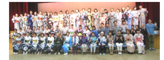
一足早い、夏を楽しんだ一日となりました。