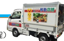
これが移動店舗の軽トラ

「次回は開催してほしい!」と大好評でした。地域の困っている声に応え、『買い物』をテーマに楽しく集える場づくりを進めるこの取り組み。高齢者の方々が気軽に楽しく買い物できる場所がたくさんできるといいですね。